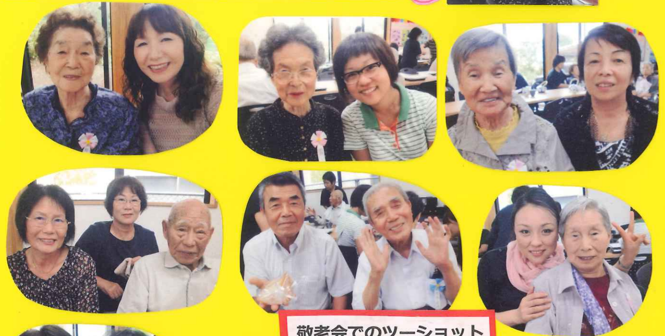
敬老会でのツーショット