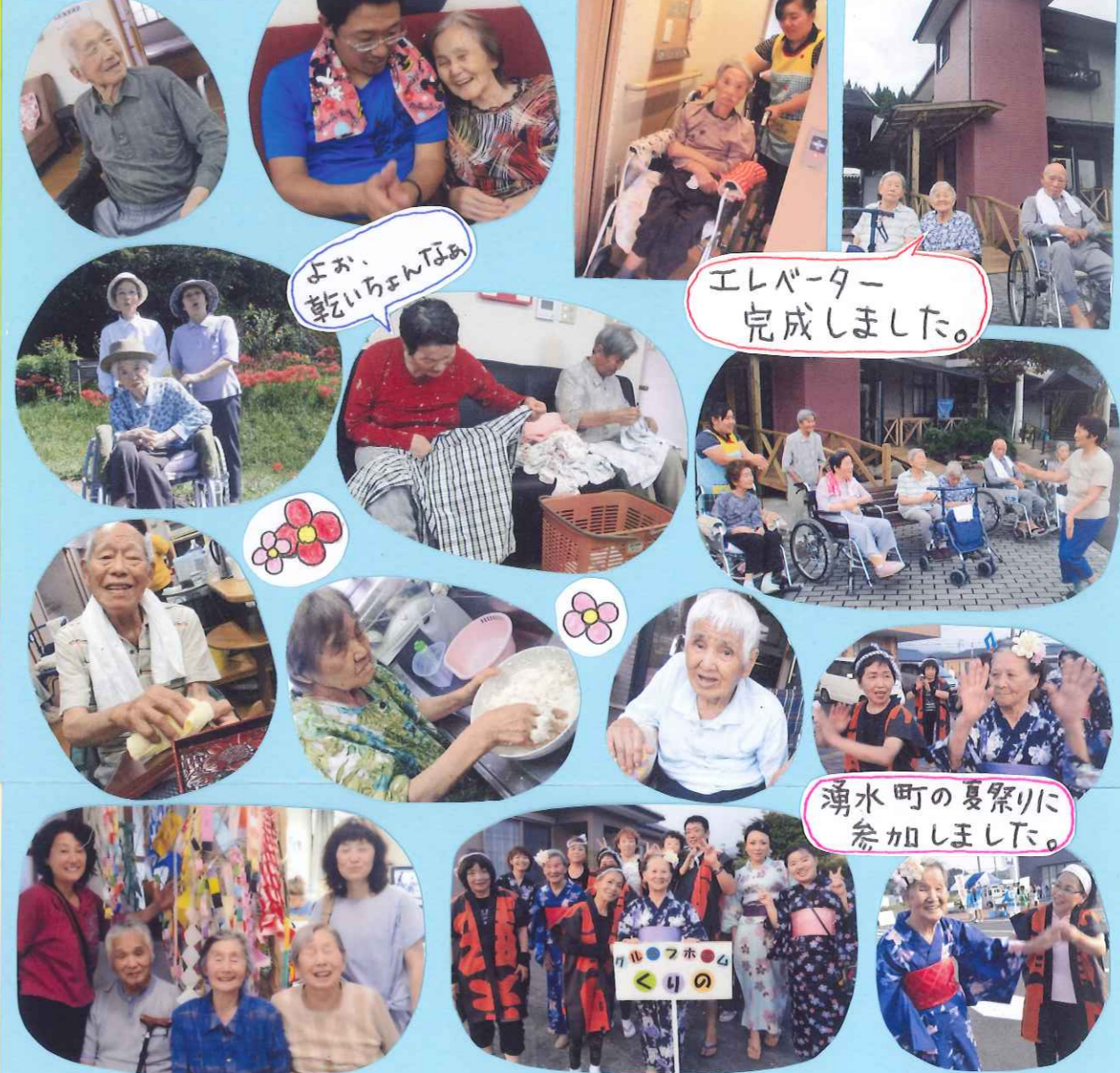
よみ、乾いちんぽん