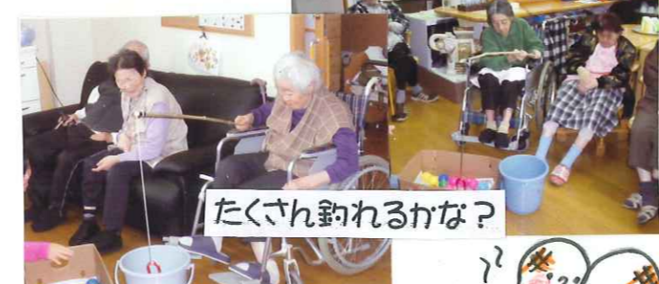
たくさん釣れるかな?