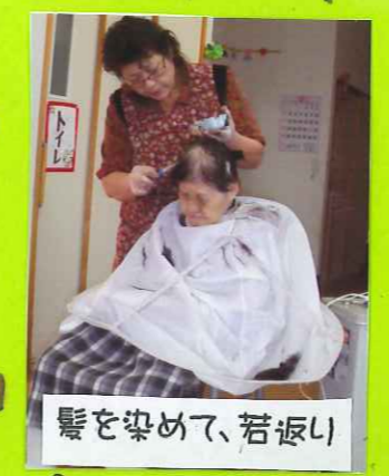
髪を染めて、若返り