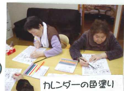
カレンダーの色塗り