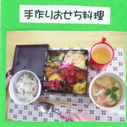
手作りおせち料理