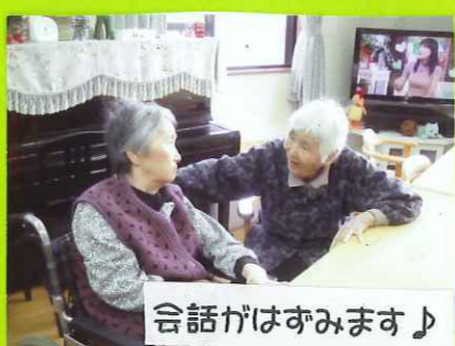
会話がはずみます♪