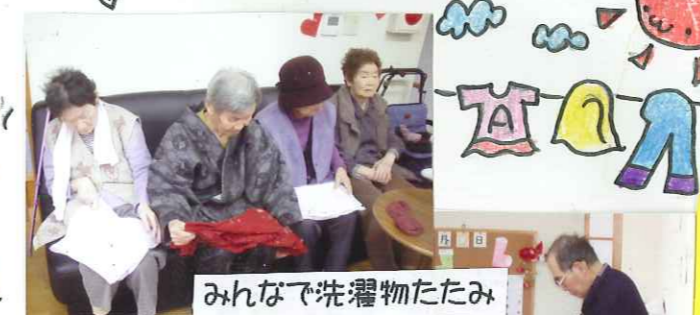
みんなで洗濯物たたみ