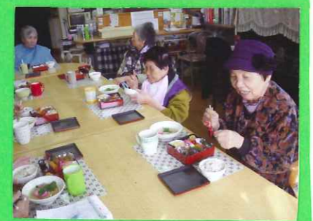
美味しくいただきました