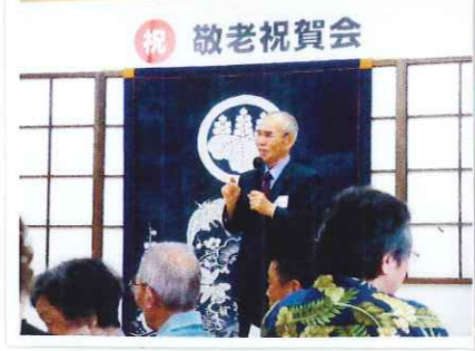
米満町長から お祝いのことば