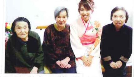
成人式を控えて晴れ着 姿をお披露目に来てく れました。 “ますます かわいいね”