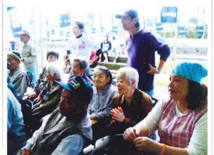
恒例の相撲見学 みんな熱心に応援しました。