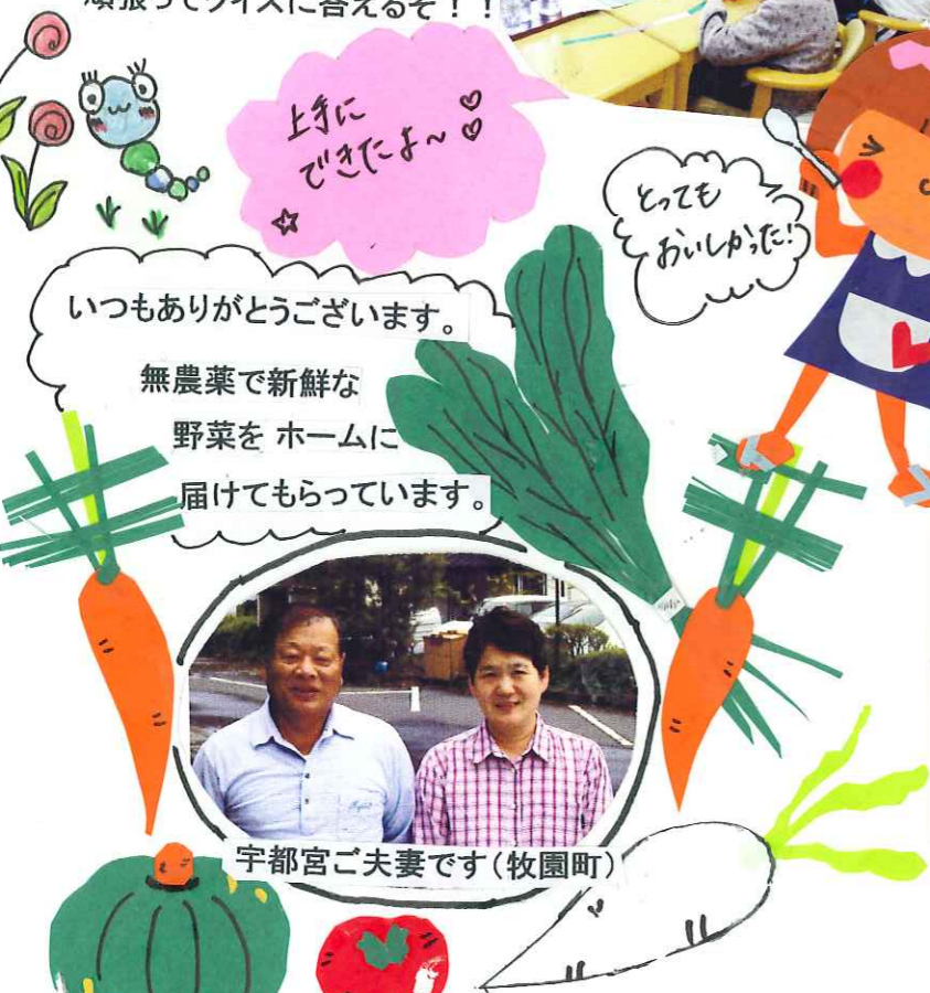
宇都宮ご夫妻です(牧園町)

始めて、カット・イラストで初デビューしてみました。絵を描く事が、とても好きなので、楽しく作業が出来ました。次回も頑張ります。*有木*