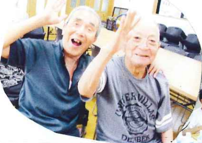
頑張ってクイズに答えるぞ!!