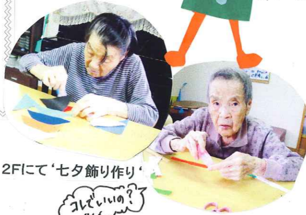
2Fにて'七夕飾り作り'