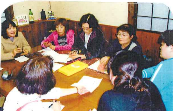
質の向上委員会の勉強会