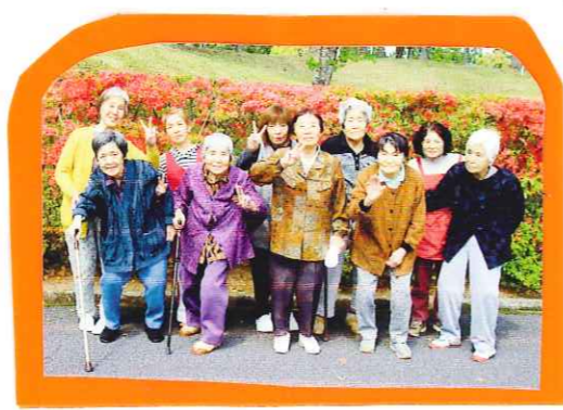
丸岡公園へドライブ(つつじ見学)