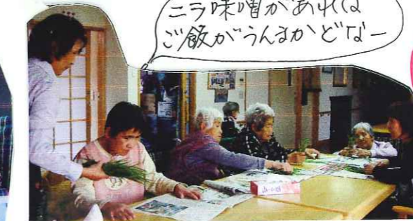
なかよし農園で作ったニラをしたごらえて ニラ味噌を作りました。皆さん、大好物です